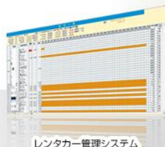
レンタカー管理システム