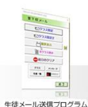
生徒メール送信プログラム

電話06-6777-2514/FAX 050-3737-5529 携帯090-7762-9180