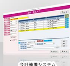
会計連携システム